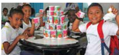
Elk kind kreeg een bakje yoghurt mee. Every child was treated to a can of yoghurt.

Tekst / Text: Kevin van Brussel