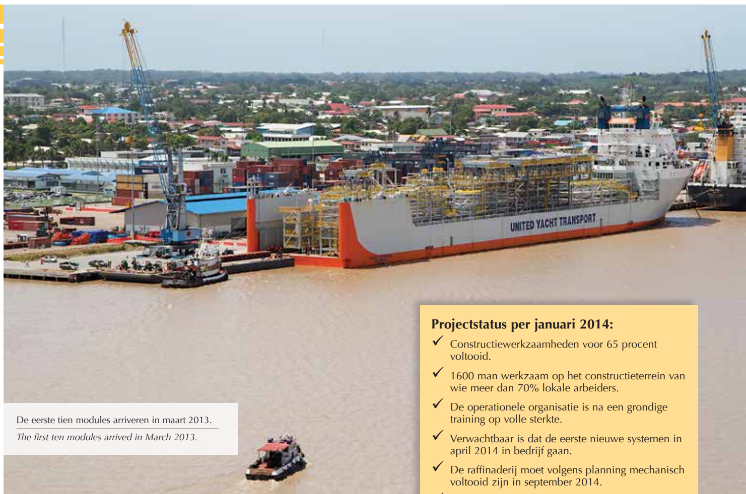
De eerste tien modules arriveren in maart 2013. The first ten modules arrived in March 2013.