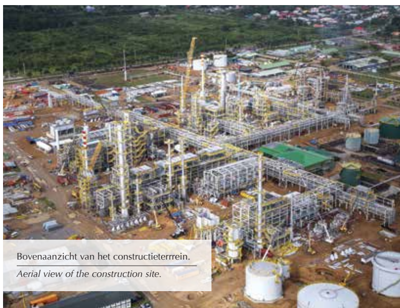
Bovenaanzicht van het constructieterrein. Aerial view of the construction site.