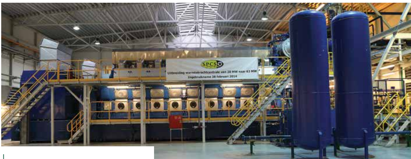
Een van de nieuwe units die in gebruik is genomen. One of the new units that is operational.