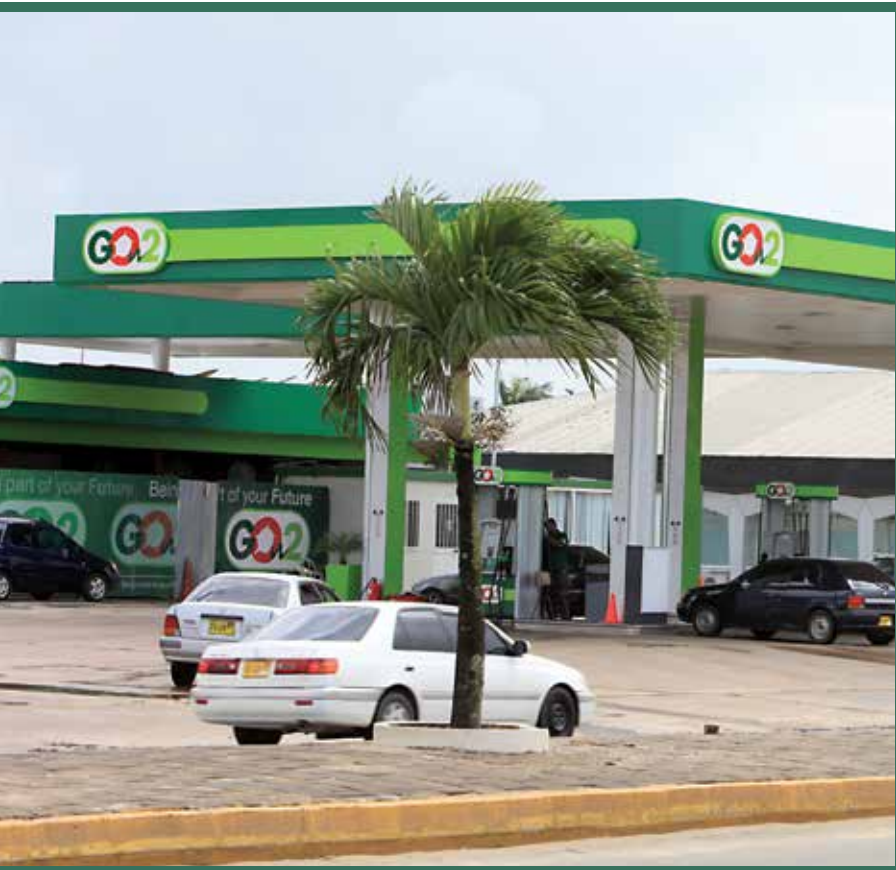
Het GOw2-servicestation aan de Van 't Hogerhuysstraat.

The oval form of the logo stands for the genes of parent company Staatsolie and it unites the several elements of the logo. It represents the different ethnicities in Suriname that together form a unity. The moving star in the red 'O' symbolizes development, the Surinamese flag and the Staatsolie genes. The 'W' comes from gowtu , meaning gold. It is linked to the 'black gold' (crude) the basis for the energy fuels supplied by GOw2. The same 'W' is considered a heartbeat, a sign of life.