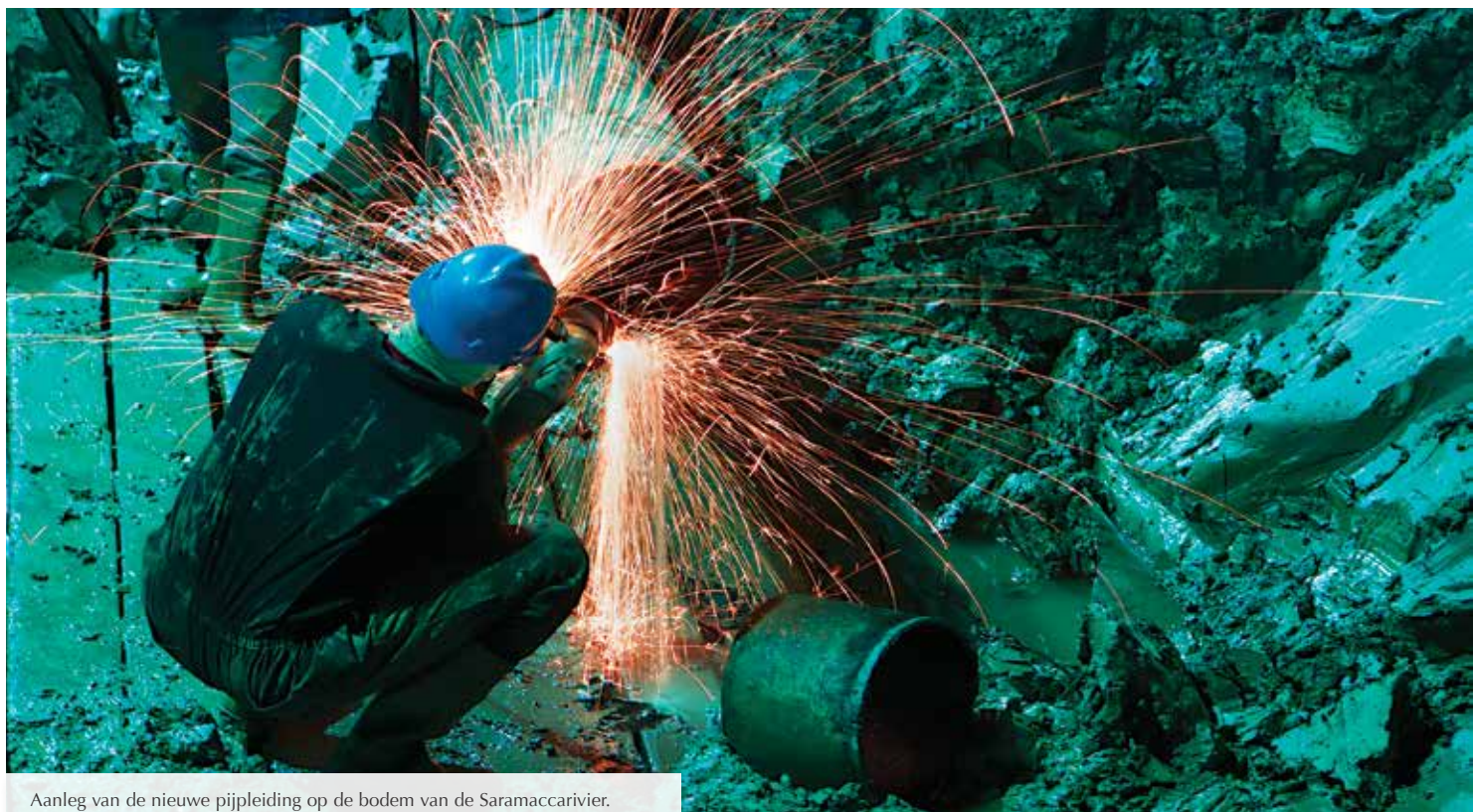
Aanleg van de nieuwe pijpleiding op de bodem van de Saramaccarivier.

Construction of the new pipeline in the Saramacca River.