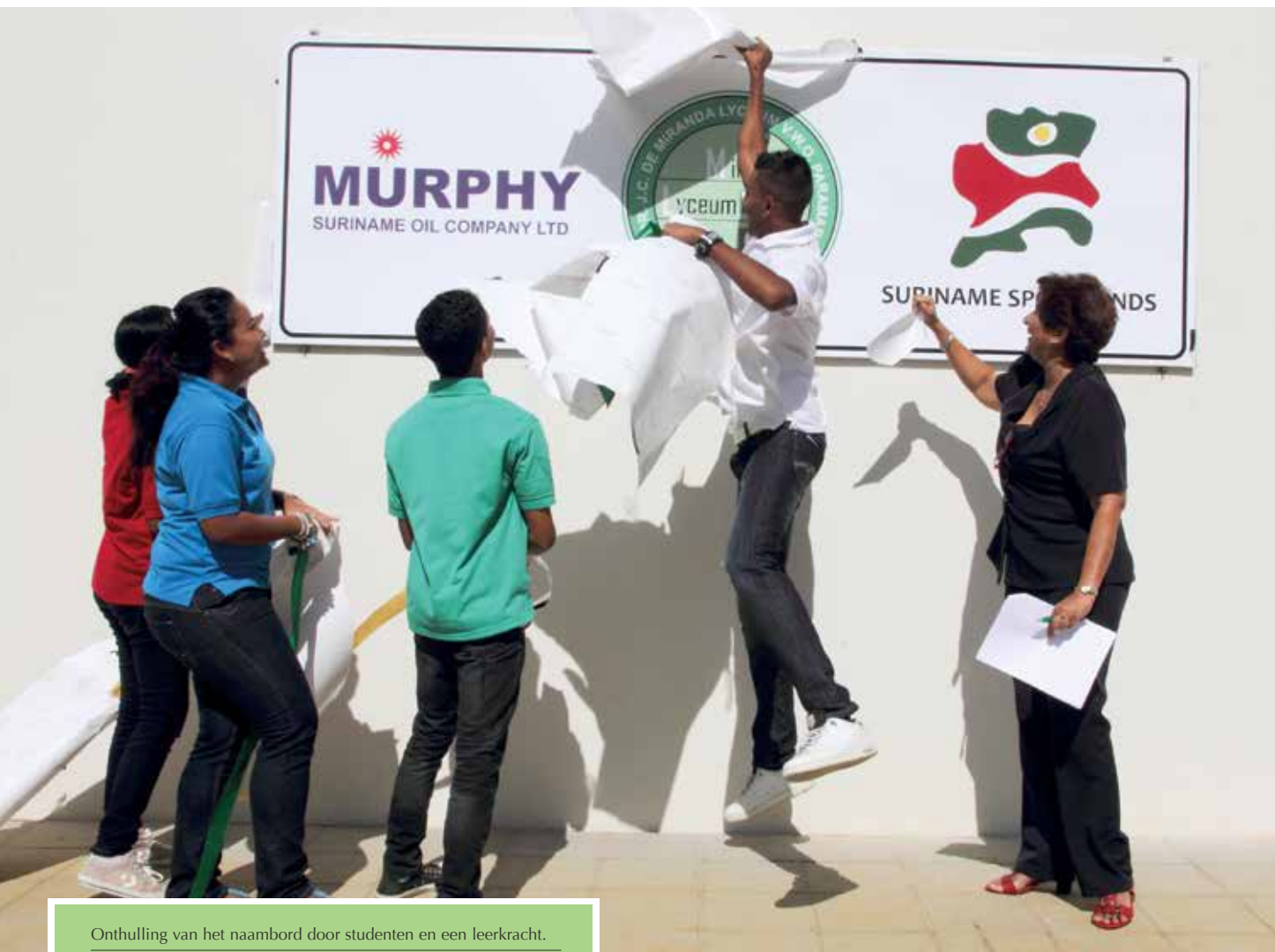
Onthulling van het naambord door studenten en een leerkracht. Students and a teacher unveil a nameplate.

Leerlingen en leerkrachten van het Mr. Dr. J.C. de Miranda Lyceum kunnen sinds oktober naar harte-lust aan sport doen in een nieuwe ruimte. Suriname Sport Ontwikkelingsfonds (voorheen Staatsolie Sportfonds) en Murphy Oil hebben samen voor een bedrag van ruim US$ 500.000 geïnvesteerd in de bouw van een moderne sporthal.