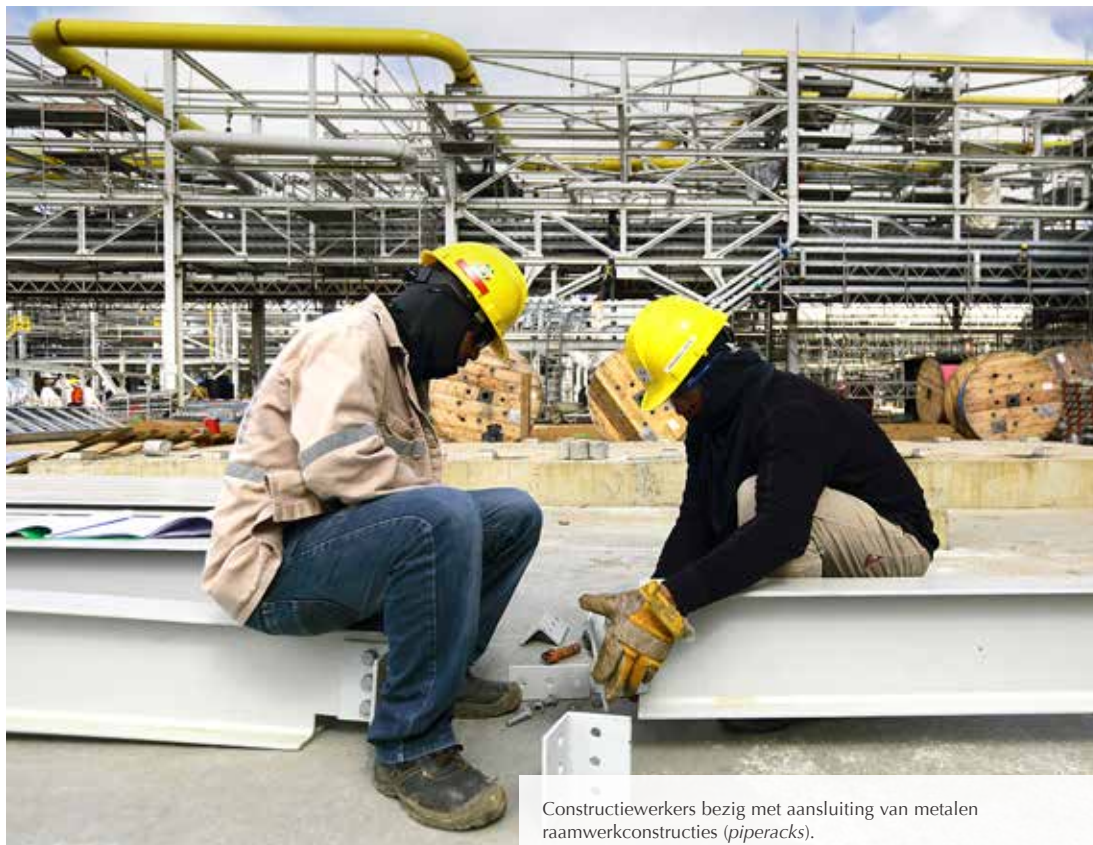
Constructiewerkers bezig met aansluiting van metalen raamwerkconstructies ( piperacks ).