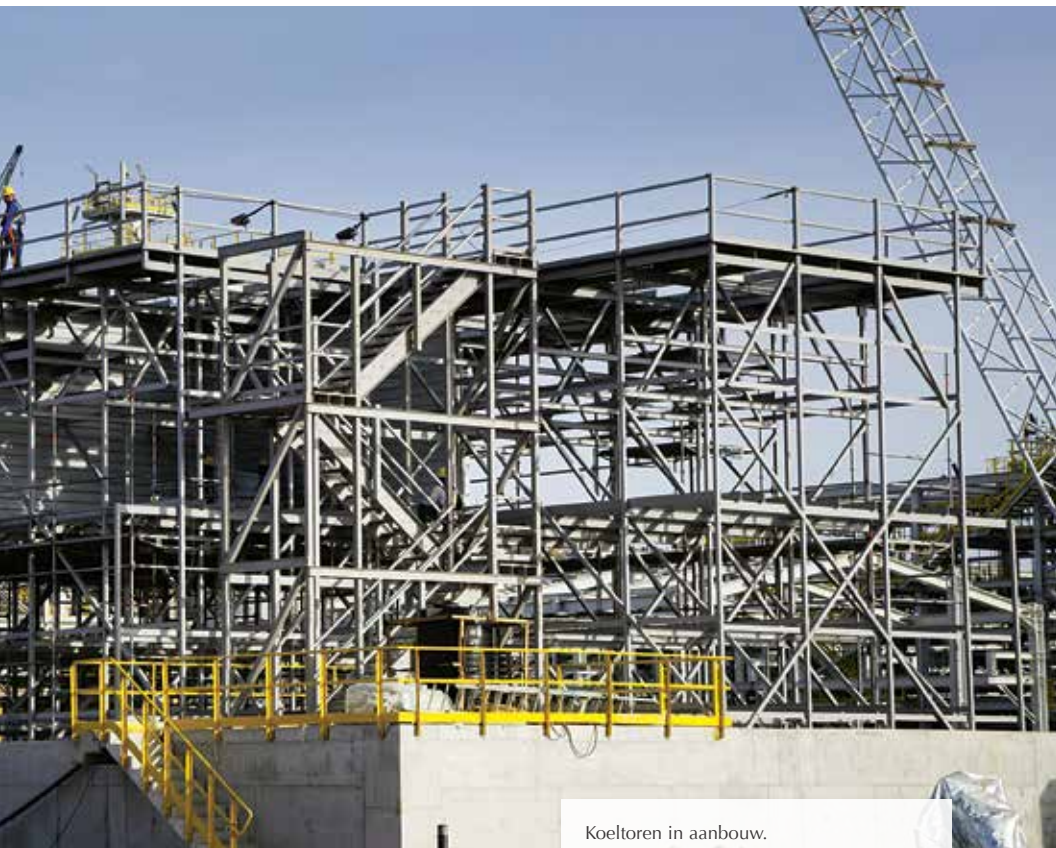
Koeltoren in aanbouw. The cooling tower under construction.