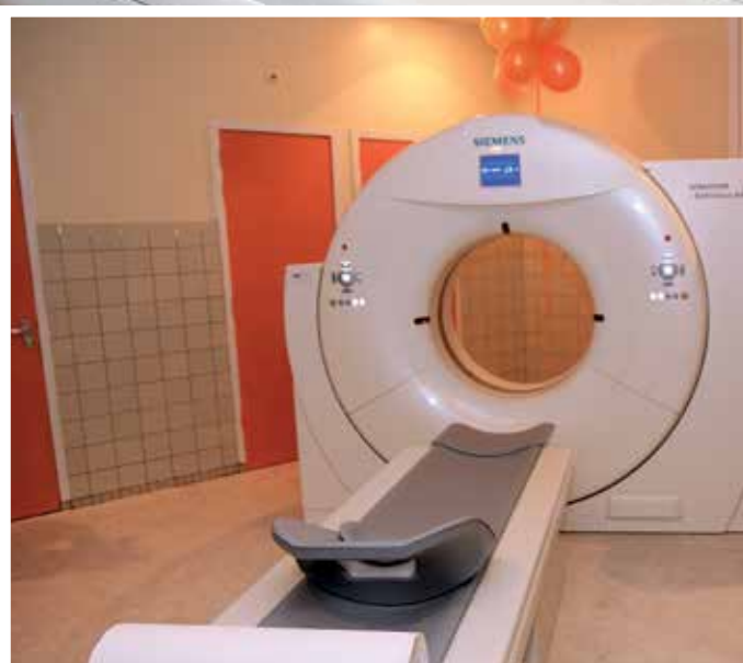
Het CT-scanapparaat/The CT-scanner.