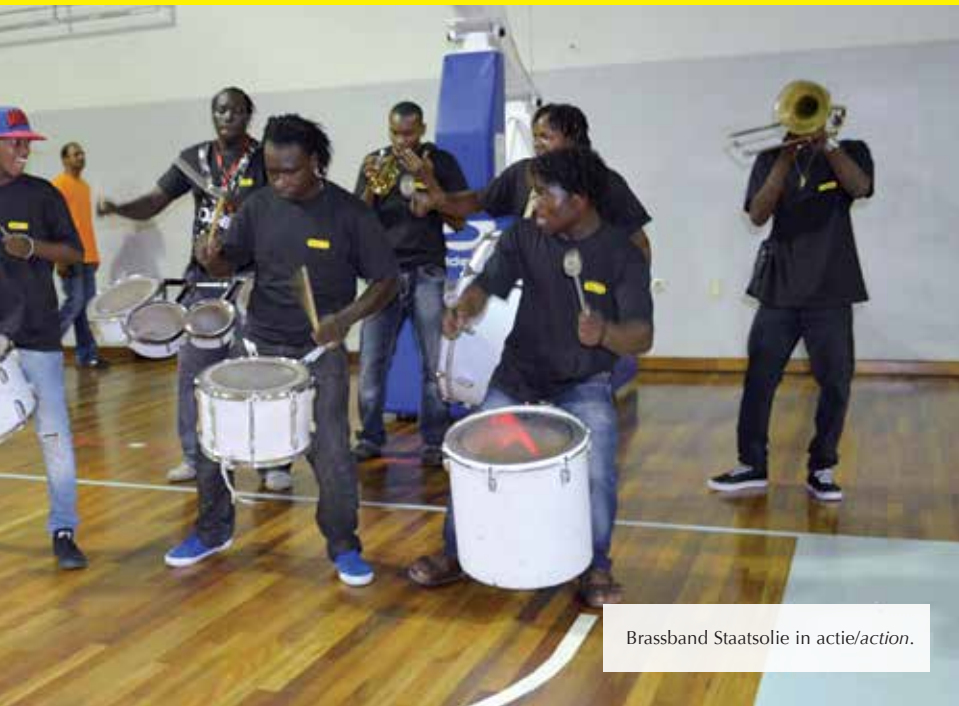
Brassband Staatsolie in actie/action.

Dit jaar hebben de Staatsoliesporters bij CTSS-Plus over het algemeen beter gepresteerd dan vorig jaar. Het team is in het algemeen geklasseerd op de zesde plaats geëindigd. Het afgelopen jaar was dat de zevende plaats. De Staatsoliezwimmers behaalden de derde plaats, de volleyballers en troefcallers eindigden op de vierde plaats. Bij "match" en zaalvoetbal was het bedrijf goed voor de zesde plaats. Bij veldvoetbal ging de strijd om de vijfde plek tussen Staatsolie en de Surinaamse Luchtvaart Maatschappij (SLM). Onze jongens wonnen na penalty's met 4-3. De slagbalsters zijn dit jaar op de zevende plaats geëindigd. Het CTSS-Plus 2013 toernooi duurde van 18 oktober tot en met 3 november 2013 en werd op diverse locaties afgewerkt. 🌟