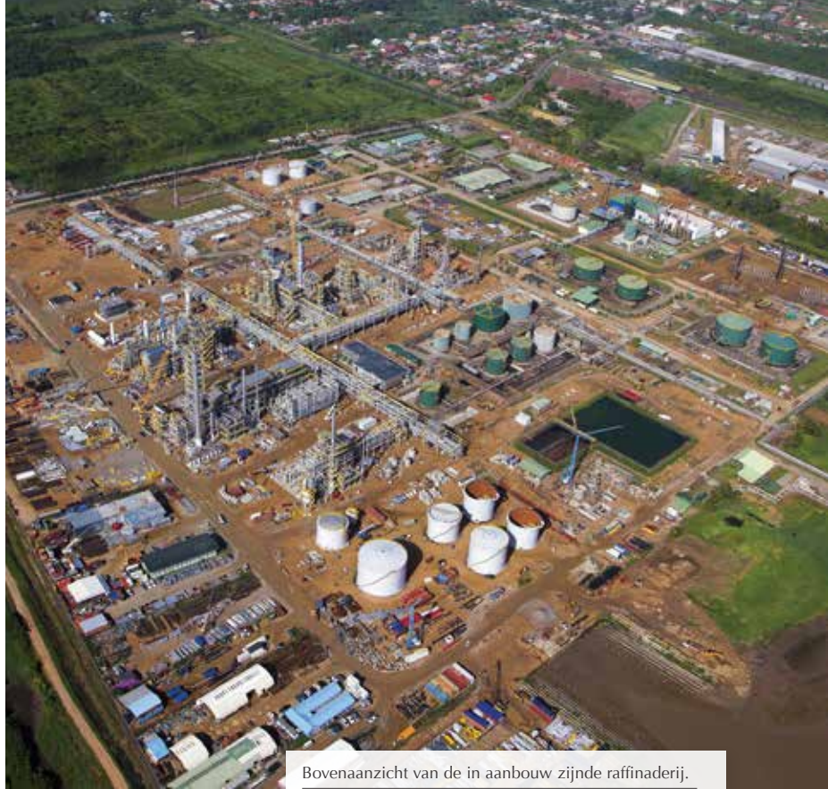
Bovenaanzicht van de in aanbouw zijnde raffinaderij. Aerial view of the new refinery.

Tekst / Text: Sherida Asinga