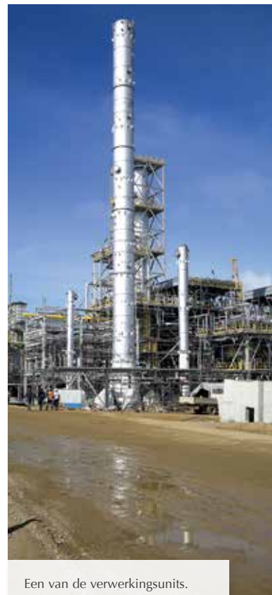
Een van de verwerkingsunits. One of the process units.

Commissioning & Start Up betekent: "in gebruik stellen en opstarten". Deze fase begint wanneer de raffinaderij is afgebouwd en alle leidingen, equipment, instrumentarium en besturingssystemen zijn geïnstalleerd. Standaardactiviteiten zijn het uitvoeren van lektesten, het doorspoelen van leidingen met water of schoonblazen met lucht en stoom. Tevens worden, pompen en compressoren voor de eerste keer gedraaid en worden alle besturingssystemen functioneel getest. Pas wanneer deze werkzaamheden goed zijn verlopen, kan er ruwe olie in de verschillende fabrieken en de nieuwe raffinaderij in bedrijf worden genomen.